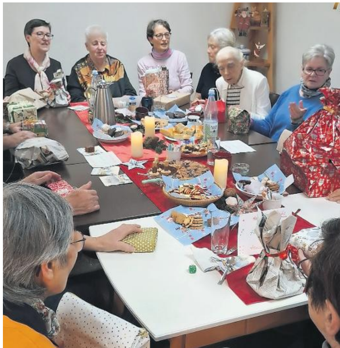
Gute Stimmung herrscht im Eckle 47.