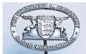
So sieht die Ehrennadel des Landes Baden-Württemberg aus.

Die Anregung zur Verleihung einer Landesehrennadel erfolgt in der Regel durch die Vereine, in Ausnahmefällen auch durch Einzelpersonen. In der Begründung sind die Vereinsaktivität, die Mitgliederzahl und ausführlich vor allem die Verdienste der zu ehrenden Person darzulegen. Weitere Pflicht-Angaben sind: Name und Vorname, Geburtsdatum und -ort, Familienstand