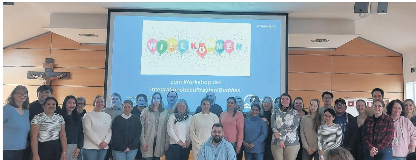
Fachlicher Austausch für eine erfolgreiche Integration internationaler Pflegekräfte: Die Integrationsbeauftragten beim Workshop in der Betriebsstelle St. Josefsklinik des Ortenau Klinikums Offenburg-Kehl.

Workshop für die Integrationsbeauftragten des Klinikums/Internationale Pflegekräfte notwendig