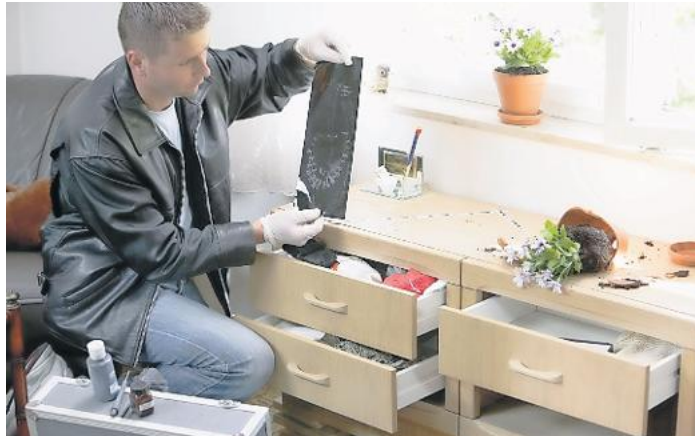
Spurensicherung nach einem Einbruch.

Wenn Sie die entsprechenden Einrichtungen haben, nutzen Sie Zeitschaltuhren für Beleuchtung und Rollos. So wirkt das Haus bewohnt. Die Außenbeleuchtung sollte mit einem Bewegungsmelder versehen sein, um das Umfeld zu sichern. Verstauen Sie Leitern,