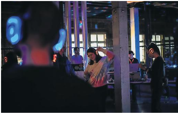
Immer wieder stark nachgefragt: die Silent-Disco.

Durch einen interessanten Mix aus Kurzführungen, Workshops, Theater, Silent-Disco und vielem mehr ist für Jung und Alt einiges geboten. In der Städtischen Galerie gibt es eine interaktive Kunststation. Bei „Still Life“ kann ein Stilleben gestaltet werden. Gleichzeitig erwarten die Gäste Pralinen und fruchtige Drinks, passend zur aktuellen Ausstellung „fruchtig!“. In den Räumen des Kunstvereins Offenburg findet die Vernissage des inklusiven Kunstprojekts „Kunstvoll verbunden“ statt, das in Kooperation mit der Diakonie Kork entstanden ist. Clevere Spürnasen und Meisterdetektive werden in der Stadtbibliothek gesucht. Dort können sich Kinder ab sechs