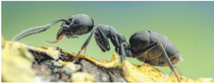
Ein Exemplar von Tapinoma magnum.

Was Betroffene bei einem Befall tun können