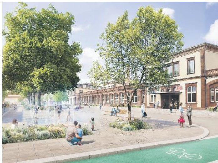
Das zukünftige Bahnhofsquartier.