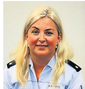
Oberkommissarin Mild gibt Tipps.

Fragen beantwortet gerne das Referat Prävention Sicherungstechnische Beratung des Polizeipräsidiums Offenburg unter den Telefonnummern 0781/21-4515 oder -1041 oder per E-Mail an offenburg.pp.praevention@polizei.bwl.de .