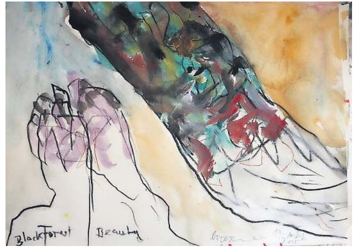
Black Forest Beauty von Rainer Braxmaier.

Rainer Braxmaier in der Reihe „KUNSTkommt“