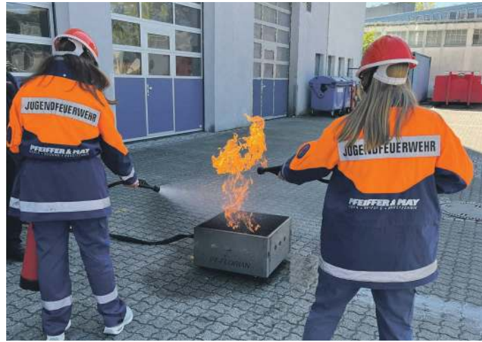
Die Schülerinnen durften ausprobieren, wie Feuerlöcher zu bedienen sind.

Im Rahmen der Zukunftstage Girls' Day und Boys' Day am 23. April hat die Stadt Offenburg zusammen mit den Technischen Betrieben Offenburg (TBO) wieder rund 25 Kindern die Möglichkeit geboten, in unterschiedlichste Berufsfelder reinzuschneppern. Darunter hospitierten sechs Schülerinnen unter dem Motto „Dein Tag, dein Weg!“ einen Tag lang bei der Feuerwehr Offenburg.