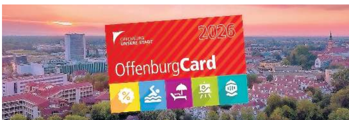
Die Vorteilskarte gibt es für 39 Euro.

So funktioniert's: Die Karte gilt nur für Erwachsene, die das 18. Lebensjahr vollendet haben. Sie ist nur im Bürgerbüro, Fischmarkt 2, erhältlich und gilt bis 31. Dezember des laufenden Jahres. Die OffenburgCard ist personalisiert und muss mit dem Personalausweis vorgezeigt werden.