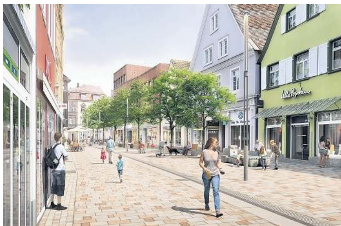
So sieht die Zukunft der Steinstraße aus.

Hintergrund: Das Bündnis Girls' Day Boys' Day Ortenau vereint verschiedene Organisationen und Kommunen. Ihr gemeinsames Ziel ist, dass sich junge Menschen über die ganze Bandbreite ihrer Berufsmöglichkeiten informieren und jenseits traditioneller Rollenbilder ihre Berufsentscheidung treffen können.