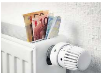
Nebenkosten senken.

Kleine Verhaltensänderungen summieren sich: Kochen mit geschlossenem Deckel reduziert den Energiebedarf. Der Wasserkocher ist effizienter als