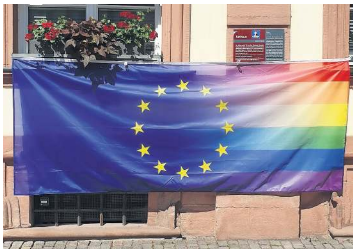
Die European Rainbow Flag weht auch vor dem Rathaus.

Am heutigen Sonntag, 17. Mai, ist IDAHOBIT, der Internationale Tag gegen Homo-, Bi-, Inter- und Transphobie. Mit dem Datum soll an den 17. Mai 1990 erinnert werden. Damals strich die Weltgesundheitsorganisation (WHO) Homosexualität aus ihrem Diagnoseschlüssel für Krankheiten. Seit 2005 wird der Tag als Aktionstag begangen. Die European Rainbow Flag ist daher vor dem Historischen Rathaus gehisst. Der Aktionstag steht im Jahr 2026 unter dem Motto „At the heart of democracy“. Die Offenburger