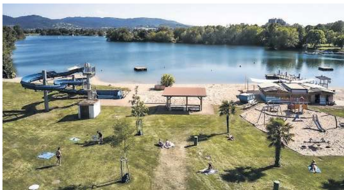
Naturbegeisterte finden Erholung im klaren Wasser des Gifz-Sees.

„Die Badewasserqualität des Strandbades Gifz wird durch das Landratsamt Ortenaukreis vor und während der Badesaison monatlich überprüft. In den zurückliegenden Jahren waren die Ergebnisse der Analyse immer bei 'Ausgezeichnete Qualität', informiert Beathalter. Eine rund 20.000 Quadratmeter