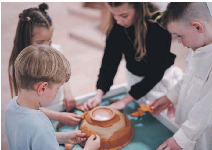
Kinder entdecken das Museum im Ritterhaus.

Das Museum im Ritterhaus ist reich an Geschichten, die anhand von tollen Exponaten erzählt werden. Dabei ist viel Wissenswertes zur Stadtgeschichte Offenburgs dabei, zu Lebenswirklichkeiten in der Ortenau in vergangenen Epochen seit der Steinzeit sowie zu den Überlieferungen aus der Kolonialzeit. In geführten Rundgängen für die ganze Familie werden am Sonntag einige dieser Objektgeschichten erzählt. Jeweils um 11 Uhr und um 13 Uhr startet „Auf Tour durchs Museum“ und um 15 Uhr die „Reise um die Welt“. Alle drei Führungen sind geeignet für Familien mit Kindern ab sechs Jahren. Ein extra für den Museumstag konzipiertes Museumsquiz leitet Besuchende