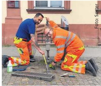
Kostenlos Durst löschen: Seite 12

+++ Felicitas Schäbitz rückt für Maren Seifert als Grünen-Stadträtin nach: Seite 3 +++ Hat Offenburg ein Müllproblem? Seite 8 +++ Überblick auf die Angebote der Nachbarschaftshilfe in Offenburg und den Ortsteilen: Seite 9 +++