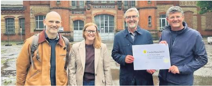
Geldsegen vom Land für Offenburger Sanierungsgebiete: Seite 2