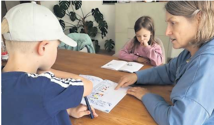
Wenn Eltern krank sind, springt die Nachbarschaftshilfe ein.

Wer sich in Offenburg nach diesen Angeboten erkundigt, stellt schnell fest, dass sich keine einheitliche Schablone über