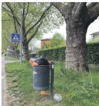
Fessenbacher Straße.

Ein weiteres Problem liegt oft unscheinbar am Boden: Gelbe